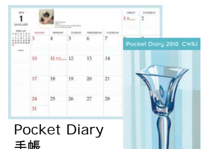
Pocket Diary 手帳