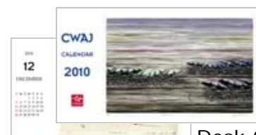
Desk Calendar 卓上カレンダー