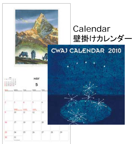
Calendar 壁掛けカレンダー